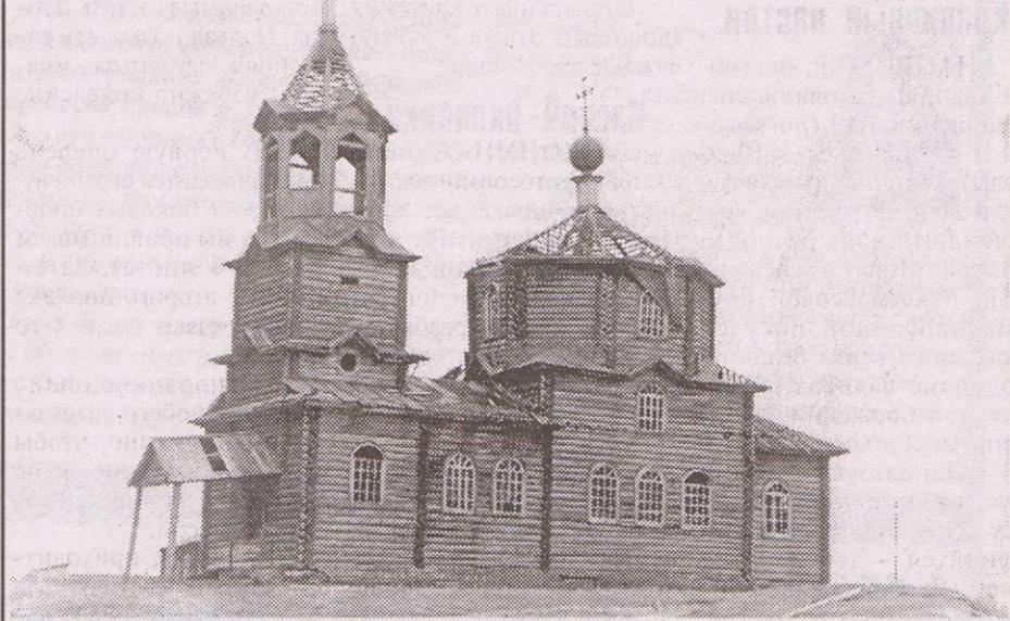
Нючпаская Прокопьевская церковь

ЭТО ОДНА из самых красивых из сохранившихся старых деревянных церквей в Коми. К сожалению, она не реставрируется.