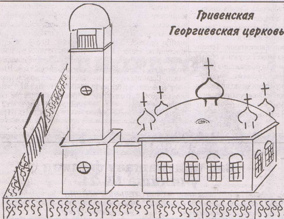
Гривенская Георгиевская церковь

ГОВОРЯТ, она была самой красивой в округе - каменной с колокольней в одной связи. Построено здание в 1833 году и имело два престола: справа - святого великомученика Георгия (освящен в 1839 году), слева - во имя святых апостолов Петра и Павла (освящен в 1840-м). Церковь была окружена железной ажурной оградой, за которой перед церковью стояла деревянная статуэтка Георгия Победоносца. В